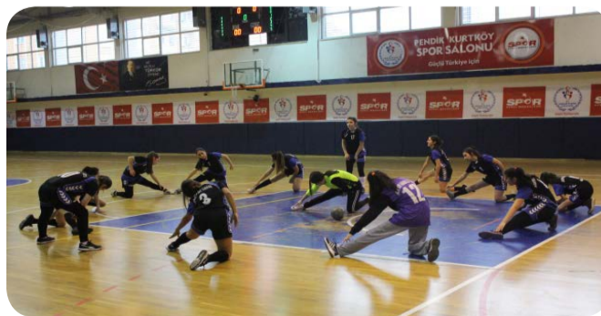
Futbol Kız Takımı İlçe Dördüncülüğü