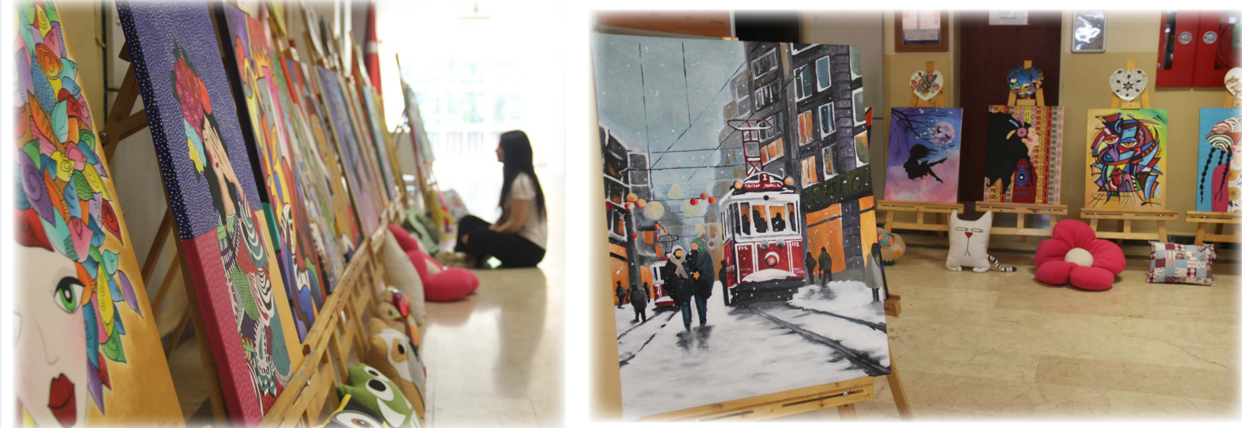
"Tekebbür eden adam; tekebbür seni adem eder." HD

"Her öğrencinin az da olsa sanata yatkınlığı vardır. Önemli olan bu yeteneğin farkında olmalarını sağlamaktır. Biz de çalışmalarımızla; öğrencilerimizin yeteneklerini çeşitli teknik ve yöntemlerle ortaya çıkarmaya çalıştık. Bunun sonucunda da atölyemizden birbirinden kıymetli eserler çıktı. Bu çalışmalarda emeği geçen öğrencilerimle gurur duyuyorum, onlara teşekkür ediyorum."