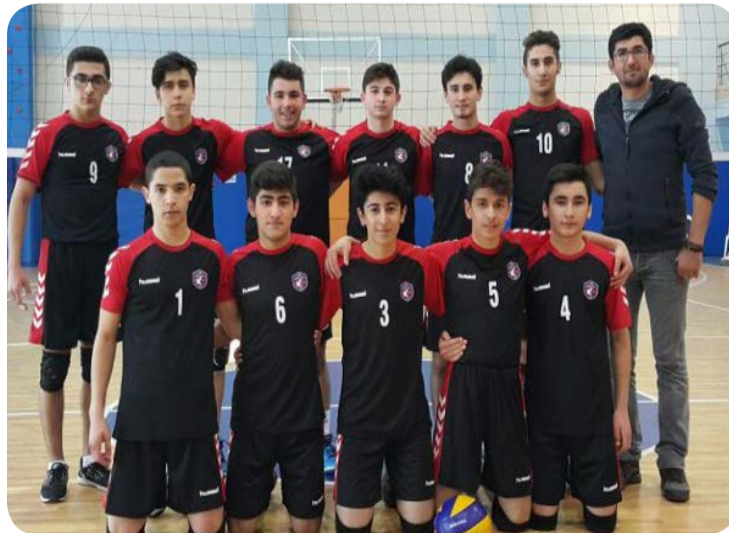
Voleybol Erkekler İlçe Birinciliği