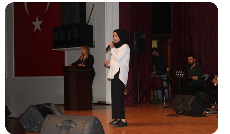
Ses Yarışması (TSM) İlçe Üçüncülüğü