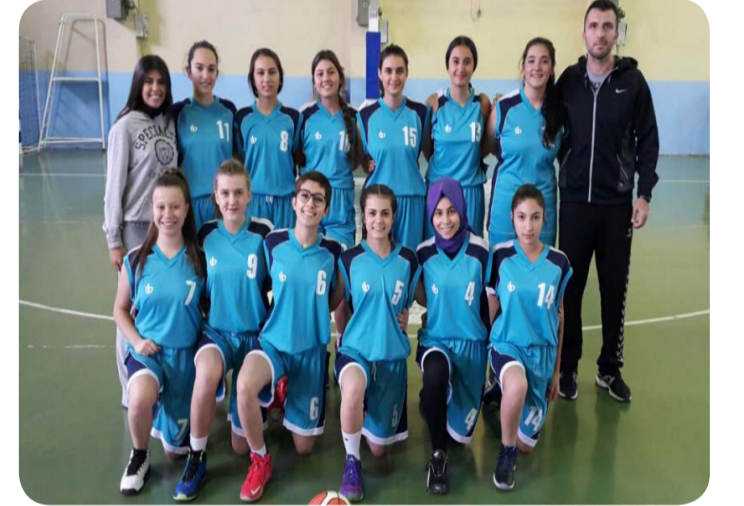
Voleybol Kız Takımı İlçe İkinciliği