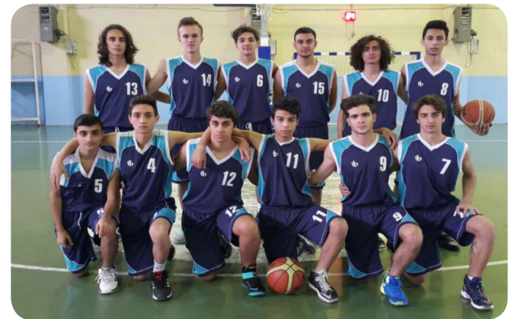
Basketbol Erkekler İlçe İkinciliği