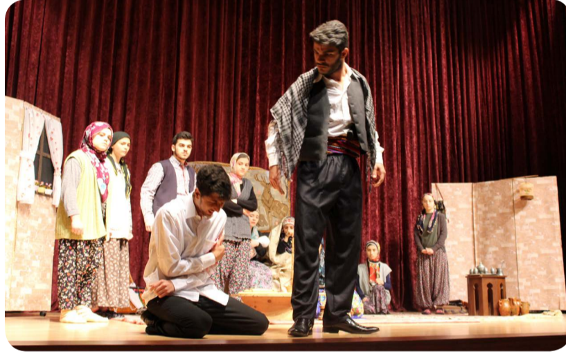
Tiyatro İlçe Birinciliği