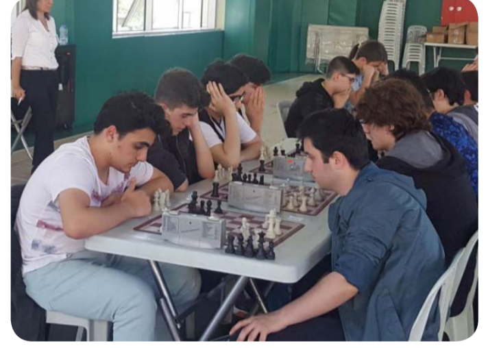
Satranç İlçe İkinciliği