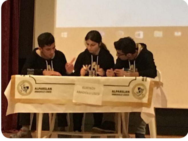
Bilgi Yarışması İlçe İkinciliği

Son yıllarda yükselişi ile dikkat çeken okulumuz bu yıl da başarılarına yenilerini ekledi.