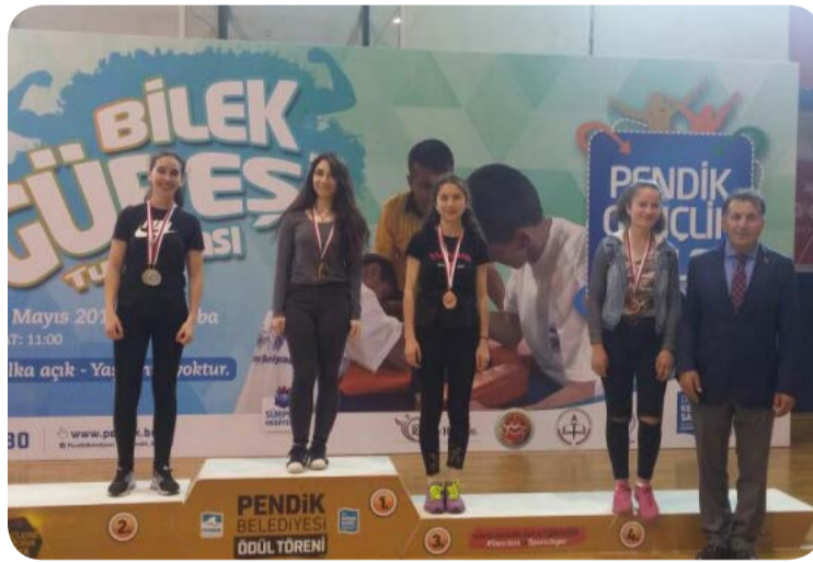
Bilek Güreşi Kız Takımı İlçe İkincisi