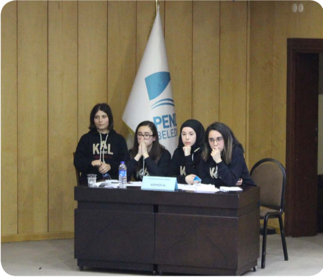
Münazara Yarışması İlçe İkinciliği