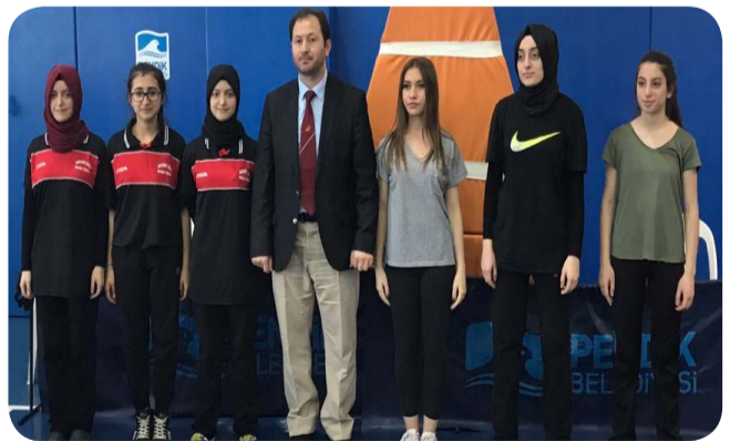
Masa Tenisi İlçe Üçüncülüğü